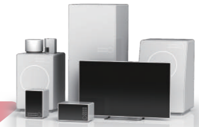
Smart home appliance