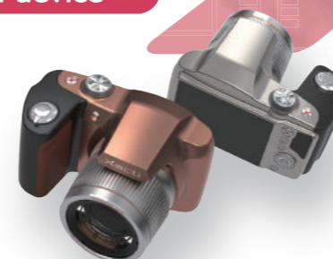
Digital still camera